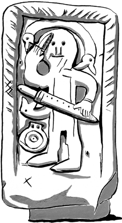
Zeichnung: Der Grabstein von Niederdollendorf

www.rheinisches-landesmuseum-bonn.lvr.de