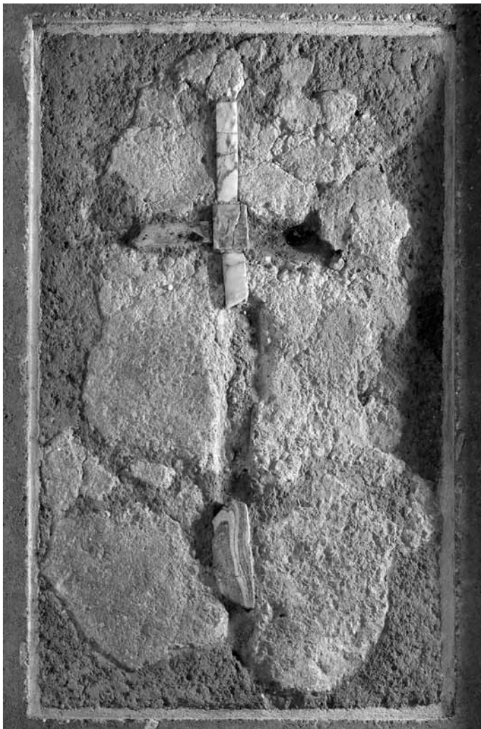
Foto: Kreuz im Estrich (6. Jh. n. Chr.), (mit freundlicher Genehmigung des Landesmuseums Bonn)