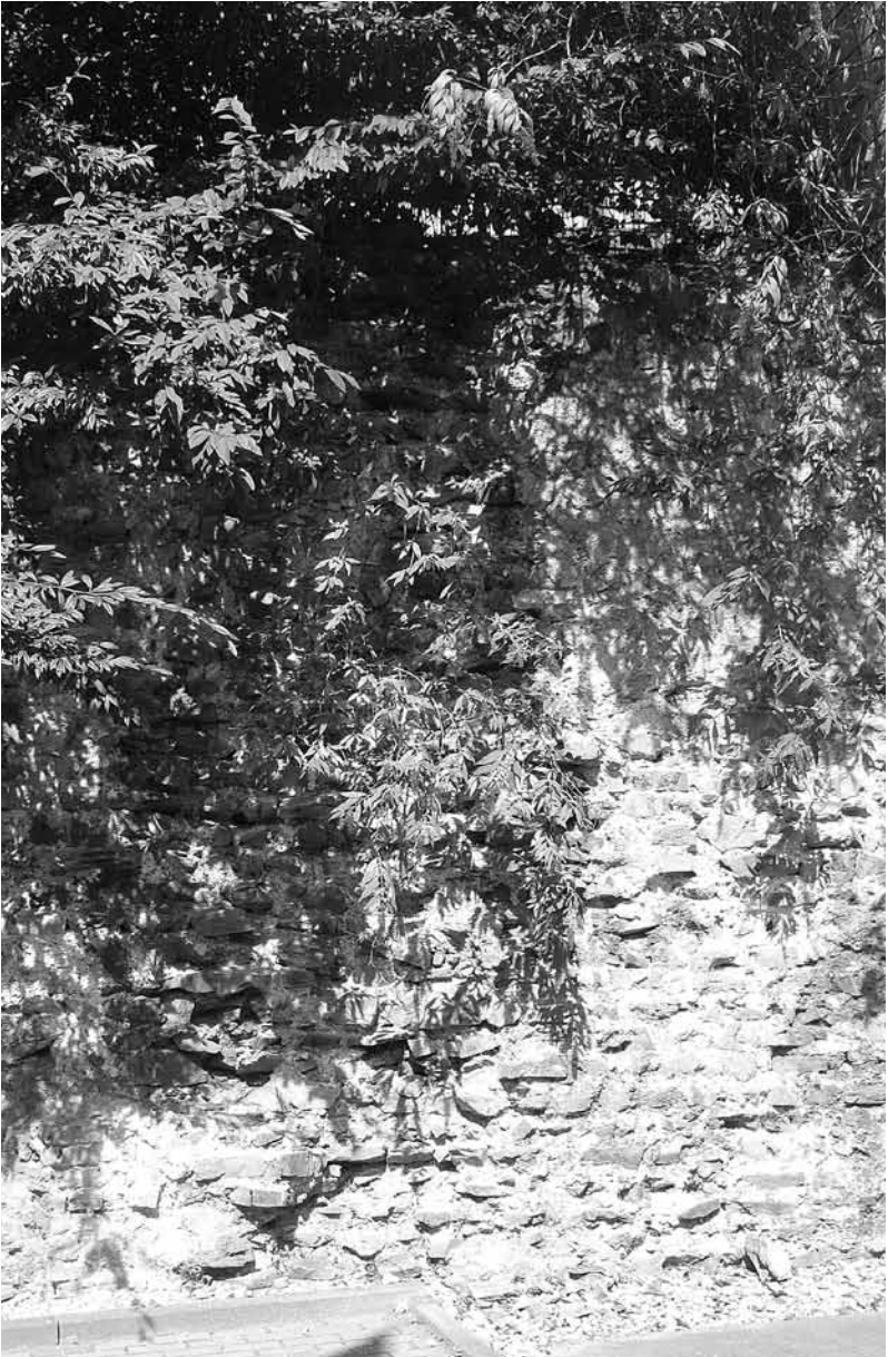
Foto: Römische Stadtmauer am Mühlbach