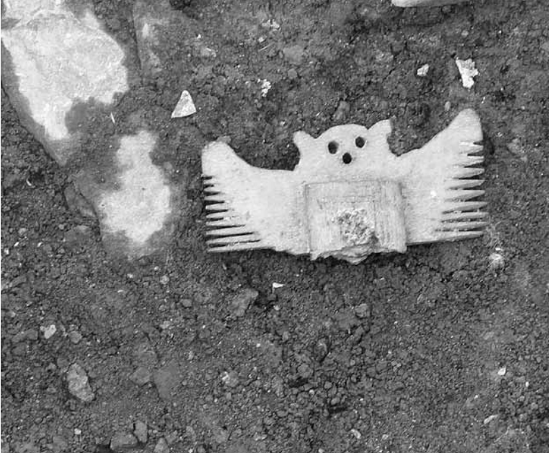
Foto: Fund eines fränkischen Kammfragments bei Ausgrabungen an der Malzmühle in Andernach

Andernach gilt als eine der ältesten römischen Siedlungen Deutschlands. Um 20 n. Chr. wurde dort, in tiberischer Zeit, am Kreuzungspunkt wichtiger Fernstraßen ein Holz-Erde-Kastell errichtet. Davor erstreckte sich der Lagervicus der im Westen vermutlich an den römischen Hafen stieß, einem heute verlandeten Rheinarm.