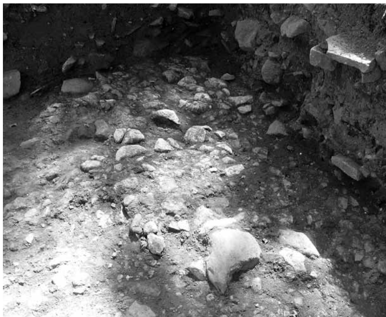
Foto: Grabungsfoto eines merowingischen Grubenhauses