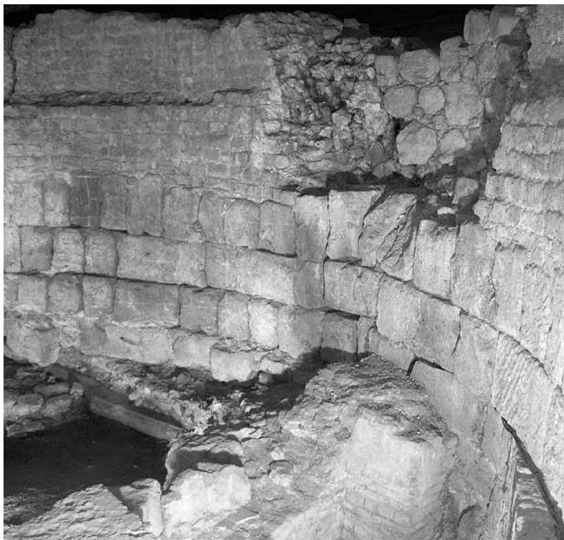
Foto: Rundsaal im Oktogon des Prätoriums (mit freundlicher Genehmigung der Archäologischen Zone Köln)