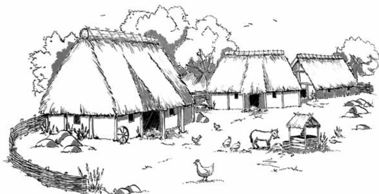
Zeichnung: Fränkisches Dorf